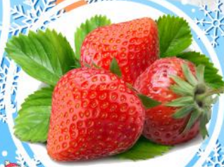
ไร่สตรอเบอร์รี่